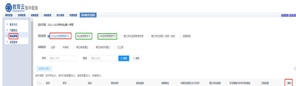
图 7 报名审核界面

第二步：“集中教务” — “高年级学生报名” — “报名审核”，进入“报名审核”页面，在“项目类型”处分别选择“公共必修课课程学习”、“专业类课程学习”、“公共选修课课程学习”，在符合报名条件的学生信息右侧操作区点击审核“通过”或“不通过”，即完成资格审核，报名审核界面见图 7。