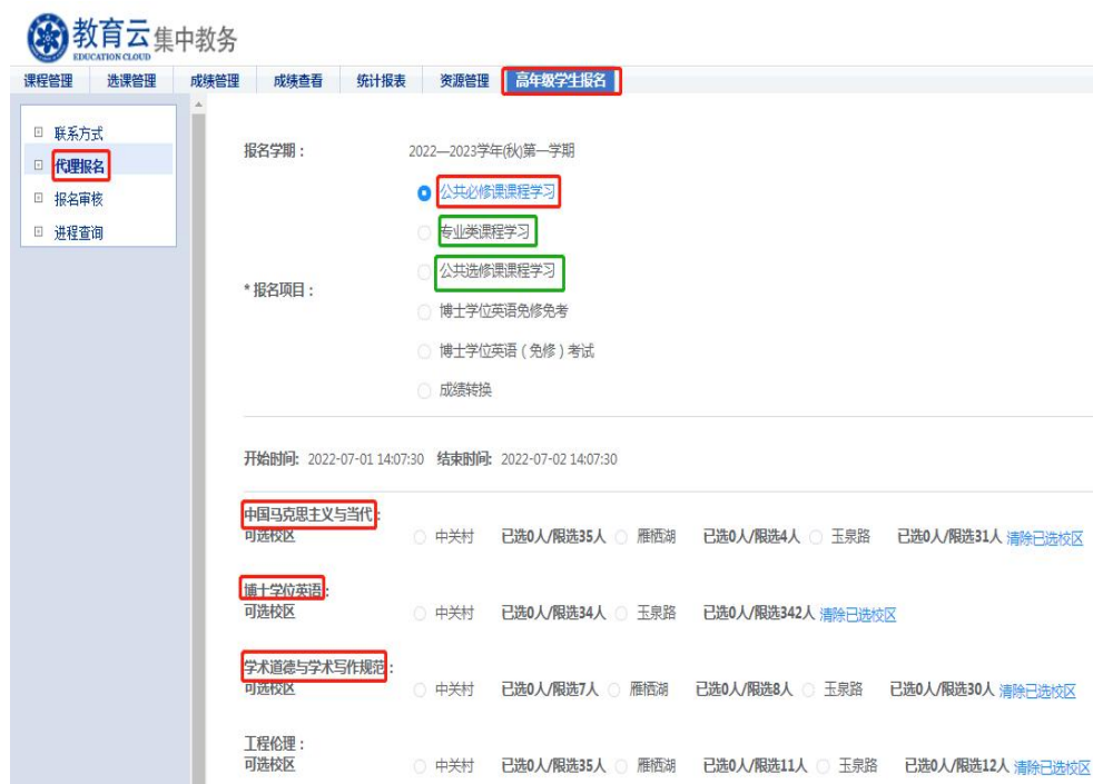
图5 教育干部代理报名界面