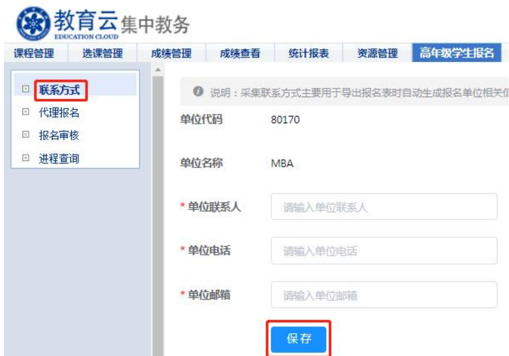
图 6 联系方式填写界面

第二步：“集中教务” — “高年级学生报名” — “报名审核”，进入“报名审核”页面，在“项目类型”处分别选择“公共必修课课程学习”、“专业类课程学习”、“公共选修课课程学习”，在符合报名条件的学生信息右侧操作区点击审核“通过”或“不通过”，即完成资格审核，报名审核界面见图 7。