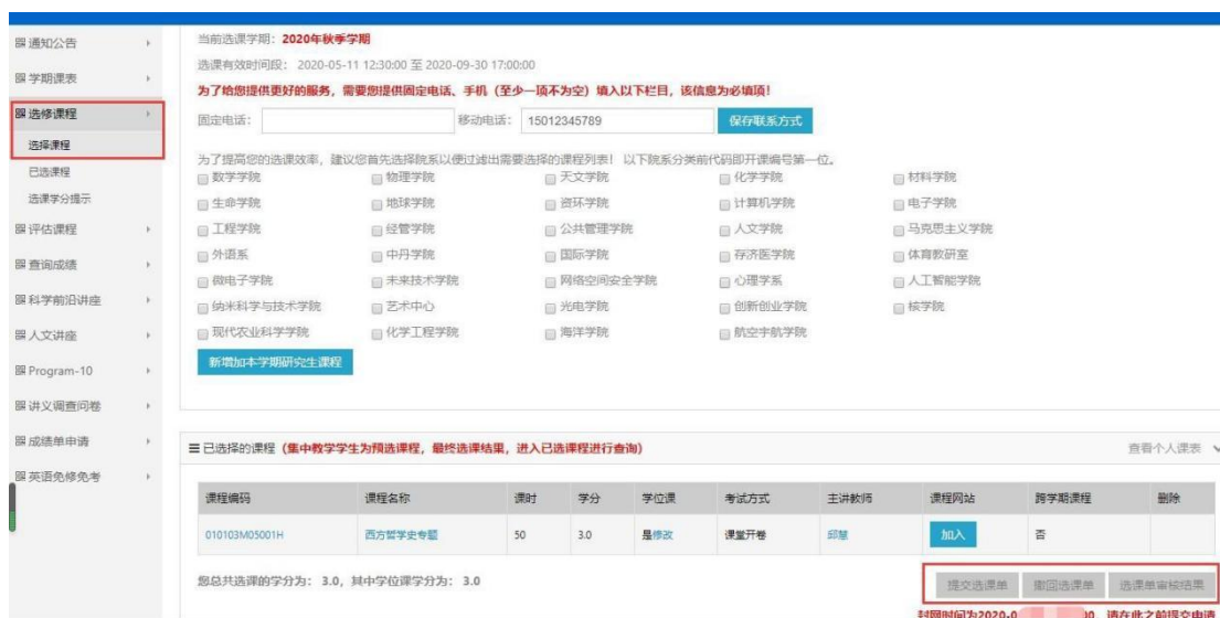
图 8 选课界面

2.选课方法：选课网址 http://sep.ucas.ac.cn/ 。首次登录系统时，用户名为学号，密码为身份证号（字母需大写）。登录后进入“选课系统”的“选修课程”模块选择课程，填写并保存联系方式后才可选择开课学院的相关课程，选课界面见图 8。