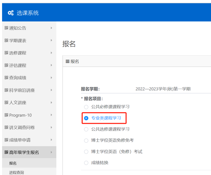
图4 “专业类课程” 报名界面（“专业类课程” 为例）

学生如需报名“专业类课程”、“公共选修课”课程，可点击对应的报名项目，单击“点击报名”，即完成报名。见图4。