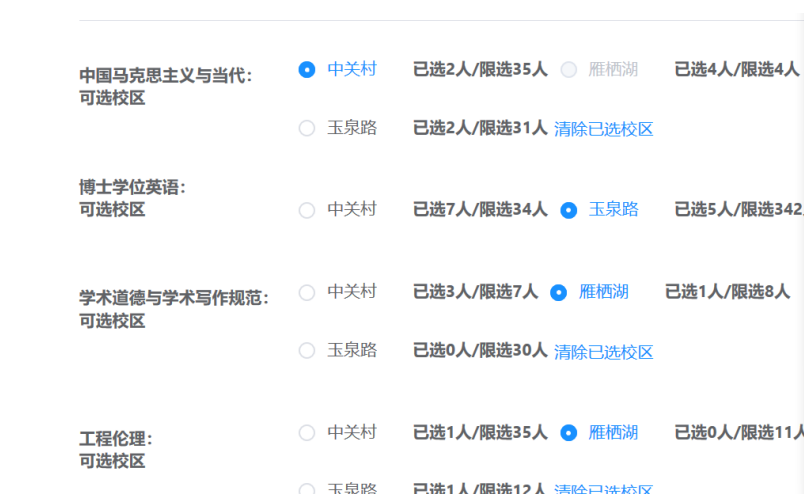
图 3 “公共必修课”课程报名

第三步，学生报名“公共必修课课程学习”项目时，须点击课程对应的校区，单击“点击报名”，即完成报名，见图 3。