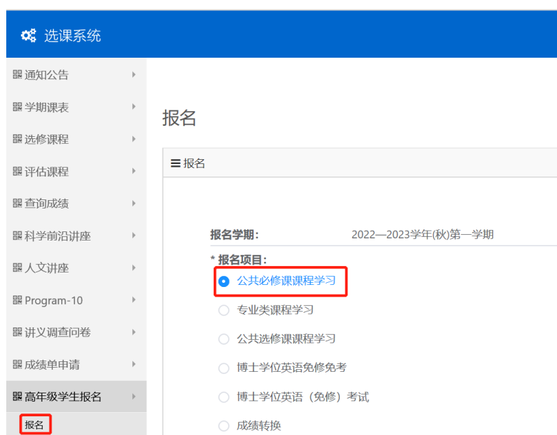
图 2 课程学习报名项目

第二步，进入“高年级学生报名”模块点击“报名”，在“报名项目”处根据自身需要点击“公共必修课课程学习”、“专业类课程学习”、“公共选修课课程学习”，见图 2。