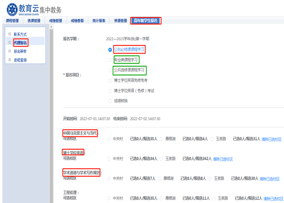
图 5 教育干部代理报名界面