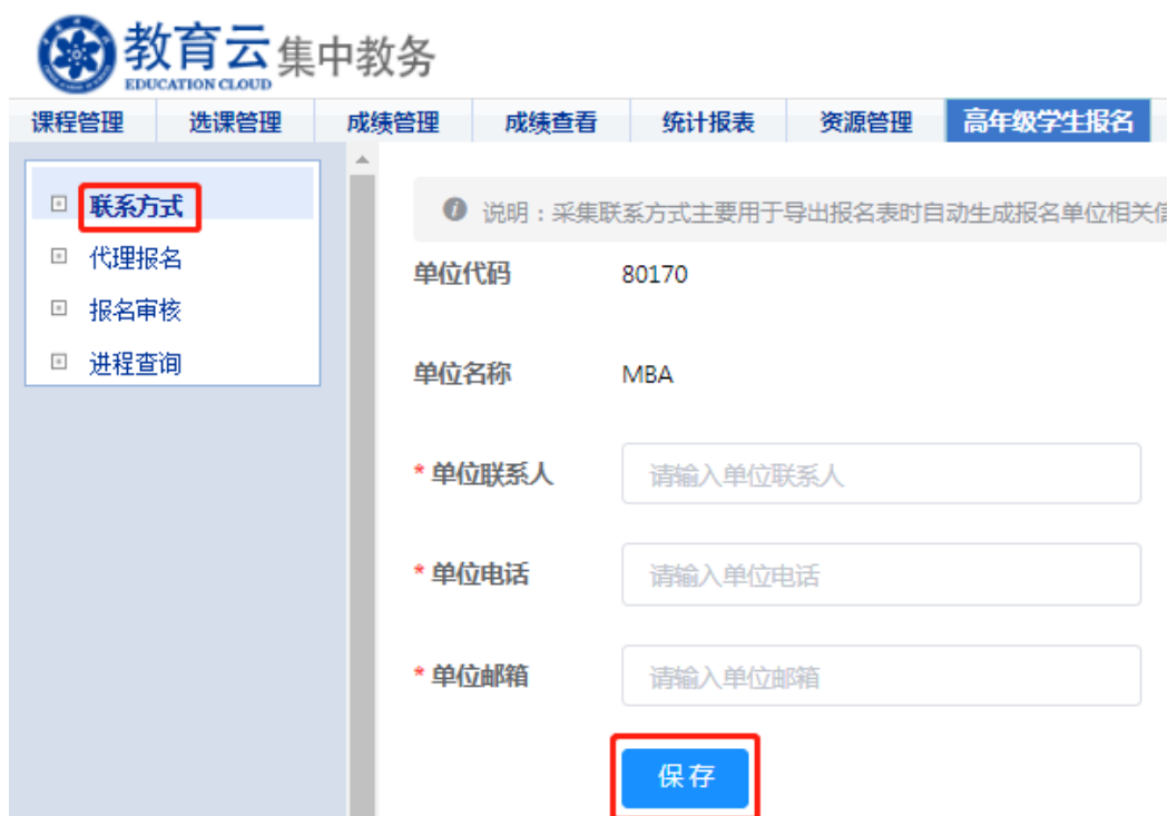
图 6 联系方式填写界面

第二步：“集中教务” — “高年级学生报名” — “报名审核”，进入“报名审核”页面，在“项目类型”处分别选择“公共必修课课程学习”、“专业类课程学习”、“公共选修课课程学习”，在符合报名条件的学生信息右侧操作区点击审核“通过”或“不通过”，即完成资格审核，报名审核界面见图 7。